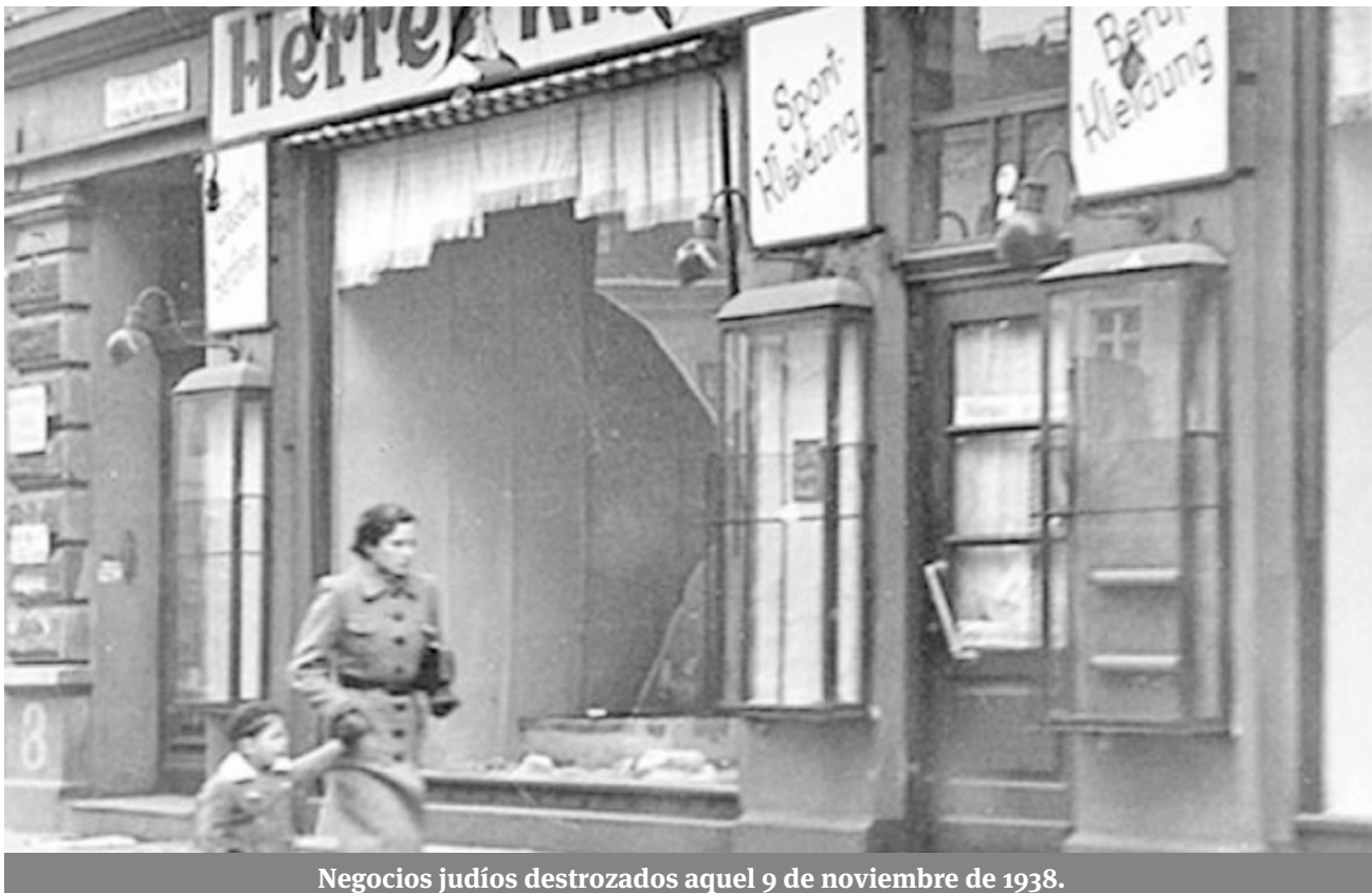
Negocios judíos destruidos aquel 9 de noviembre de 1938.