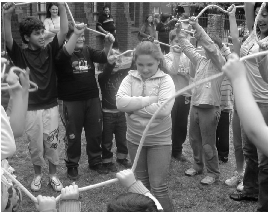
Fiesta del Día de la Familia