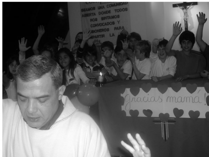
Misa del Día de la Madre