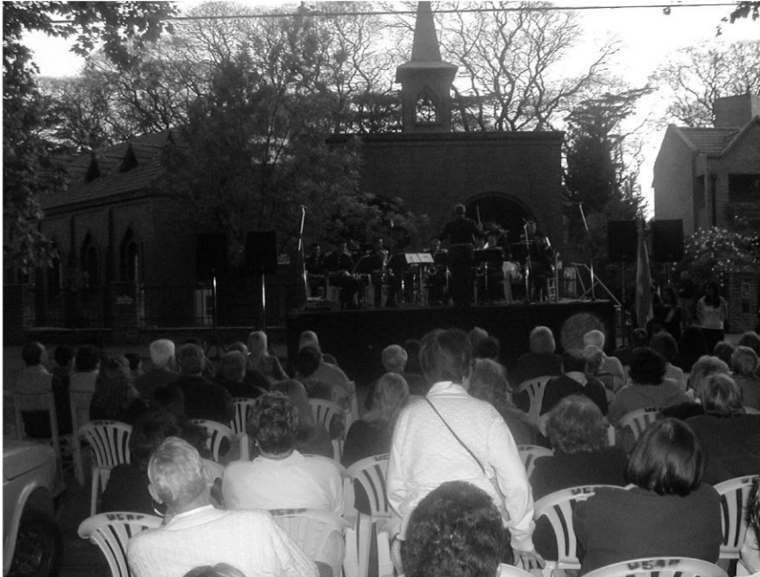
Concierto de la Banda del Colegio Militar de la Nación frente a la Capilla San Roque

En el marco de las Fiestas Patronales, se han desarrollado, durante el mes de octubre, varias actividades litúrgicas, culturales, sociales y lúdicas. He aquí el testimonio de algunas de ellas: