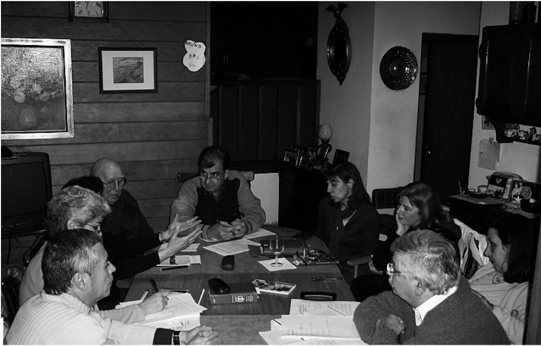
El equipo de Familia preparando el encuentro

E l día 14 de Junio se llevó a cabo el primer encuentro del año para Divorciados en Nueva Unión. La temática preparada giró sobre el "Amor incondicional de Dios como fundamento de nuestras vidas" porque en tiempos en que hablamos mucho sobre el amor sin irradiarlo, es necesario llevar un mensaje de esperanza y amistad a nuestros divorciados en nueva unión.