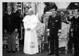
Junio de 1982 Juan Pablo II con Galtieri y los comandantes

En diciembre de 1981 el general Leopoldo Fortunato Galtieri reemplazó al presidente Roberto Viola en un golpe dentro del golpe. Había tomado en serio la calificación de "general majestuoso" que, entre sonrisas socarronas, le adjudicaron los norteamericanos en los corrillos diplomáticos.